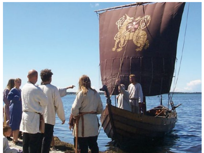
Erik Emune är tillverkat av museets skickliga och kunniga marinarkeloger och båtbyggare.

*i ändelse. **som i engelska. : = ordskillnadstecken.