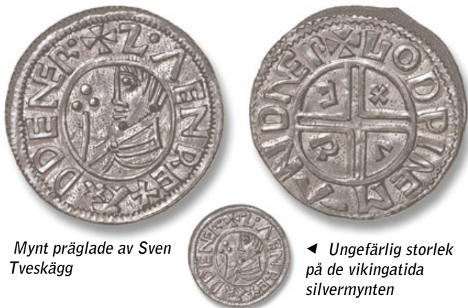
Mynt präglade av Sven Tveskägg