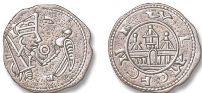
Niels (1104-1134) eller "NICOLAVS" som det står på myntet, hade förutom kungabilder även byggnader på sina mynt.

På ena sidan finns ett porträtt med spira, på baksidan ett kors och texten "CRUX" (latin: kors). Mynten har ett engelskt mynt som förebild.