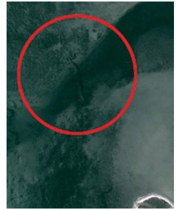
Foteviksspärren vid inloppet till foteviken syns på satellitbilder.

I början av 1980-talet påträffades fem sänkta vikingaskepp i spärren i viken benämnd Foteviken strax norr om vikingamuseet. Vid en marinarkelogisk undersökning togs ett av skeppen upp. De konserverade delarna av skeppet finns i utställningen. Fotevikens Vikingamuseum har även gjort en fullskalekopia av skeppet, det är elva meter långt och är döpt efter Erik Emune, segraren efter slaget vid Foteviken den 4 juni 1134.